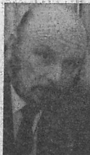
● Charles Hubert Bodet feierte Wiedersehen mit „Monte“-Star Gregory.